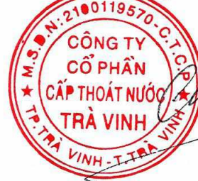
Trương Công Chiêm Chủ tịch Hội đồng quản trị